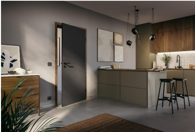
Bild 1: Mit den zweifarbigen Innentürelementen setzt Huga neue Maßstäbe in der Innenraumgestaltung.

Download Texte und Bilder: www.huga.de/presse