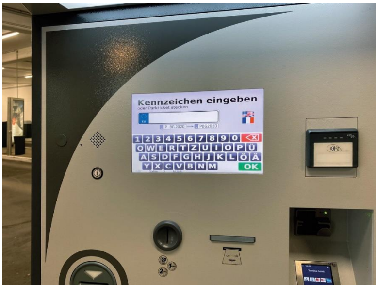
Bild 2: Beim bezahlten Parken ermöglicht die Kennzeichenerkennung eine Bezahlung ohne Parkticket durch Eingabe des Kennzeichens am Kassenautomaten.

Download Texte und Bilder: www.hoermann.de/presse