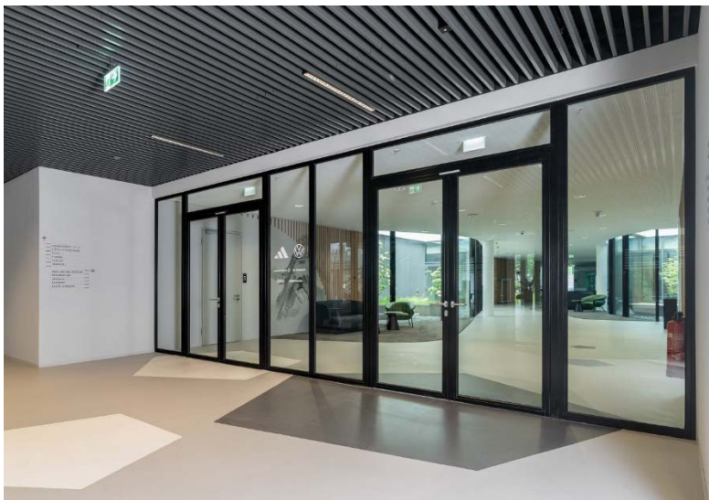
Bild 9: Die vollflächig transparenten Stahl-Rohrrahmenobjektüren mit Seitenteilen und Oberlichtern von Hörmann schaffen in den großzügig gestalteten Durchgangsbereichen Brandabschnitte. Zugleich lassen sie natürliches Licht ins Innere des Gebäudes gelangen.

Bild 8: Die Schulungs- und Seminarräume des DFB-Campus werden durch Stahl-Rohrrahmenobjektüren von Hörmann betreten. Die zusätzlichen Festverglasungen als Seitenteile sorgen für erhöhte Transparenz.