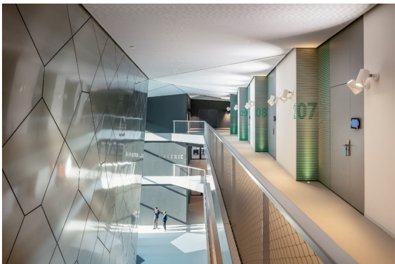
Bild 5: Die Zimmer der Spieler sind entlang des Boulevards aufgereiht. Von dort erfolgt der Zugang zu den Übernachtungsmöglichkeiten für je 2 Personen pro Zimmer. Foto: HG Esch

Bild 4: Immer wieder finden sich Geometrien des Fußballs als Gestaltungsmittel wieder. Auf dem Boden sind es die fünf Ecken eines klassischen Fußballs. Foto: HG Esch