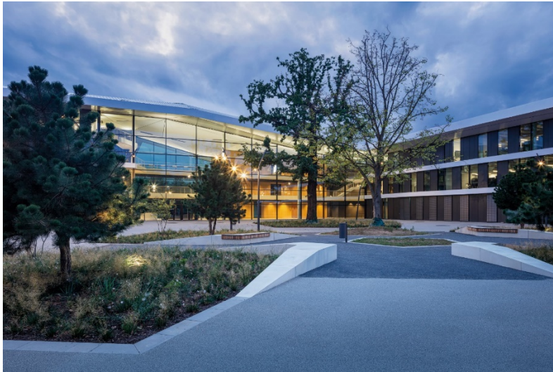
Bild 2: Transparente Fassaden und der einladend gestaltete Vorplatz kennzeichnen den DFB-Campus in Frankfurt am Main.