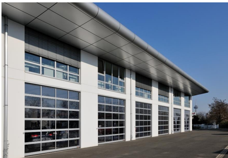
Bild 5: Das Industrie-Sectionaltor ALR 67 Thermo von Hörmann verfügt über 67 mm starke Lamellen und thermisch getrennte Verglasungsprofile. Somit verbindet es eine sehr gute Wärmedämmung mit maximaler Transparenz.

Bild 4: Das SPU 67 Thermo (links) minimiert durch die größere Lamellenstärke und die thermische Trennung nochmals besser den Temperaturverlust an der Gebäudeöffnung als das SPU F42 Thermo (rechts) von Hörmann, das bereits über eine gute Wärmedämmung verfügt.