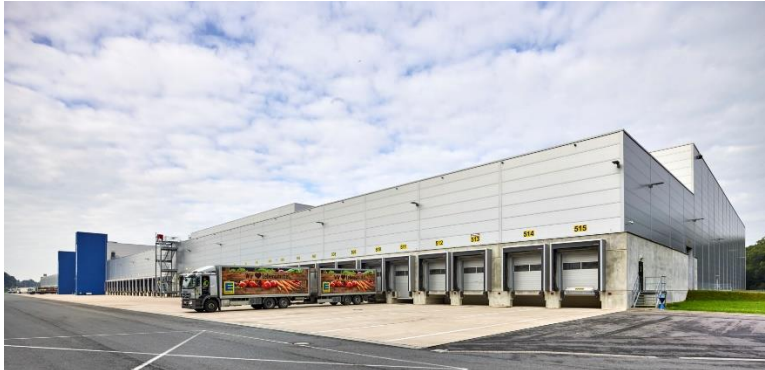
Bild 1: Im erweiterten Zentrallager Wiefelstede der EDEKA Minden-Hannover kommen überwiegend Tore, Türen und Verladetechnik von Hörmann zum Einsatz.

Hörmann KG Verkaufsgesellschaft Tore · Türen · Zargen · Antriebe