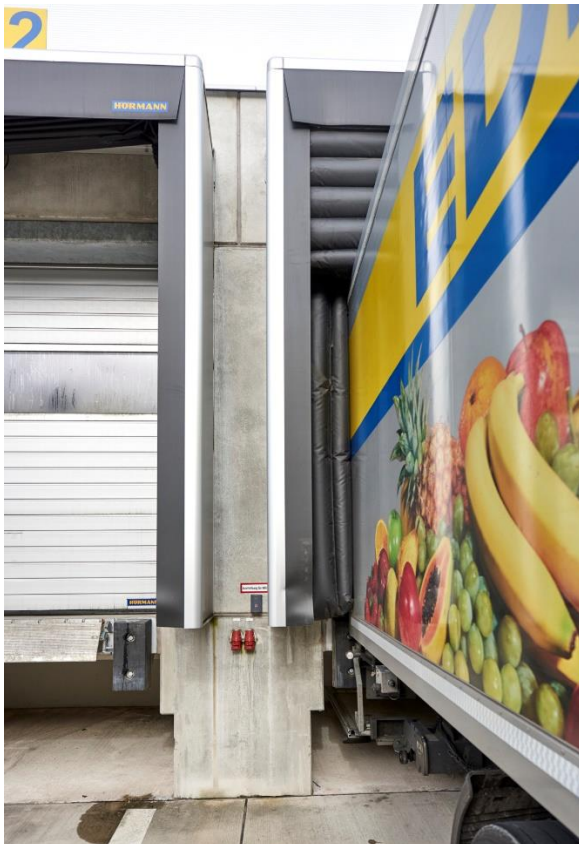
Bild 3: Die dreiseitig aufblasbaren Torabdichtungen passen sich den unterschiedlichen Lkw-Größen an und verhindern so weitestgehend das Eindringen von Wärme.

Bild 2: Alle Verladestellen am EDEKA-Lager sind mit Hörmann Verladetechnik und Hörmann Industrie-Sectionaltoren ausgestattet.