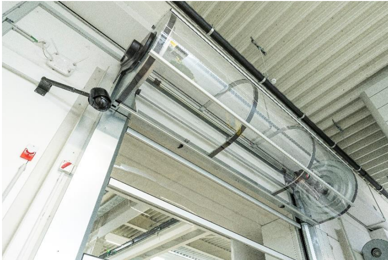
Bild 2: Die Spirale und der innenliegende Antrieb der Hörmann TurboLux Schnellauftore sind durch eine transparente Wellenverkleidung vor Staub, Feuchtigkeit und Beschädigungen geschützt.

Download Texte und Bilder: www.hoermann.de/presse