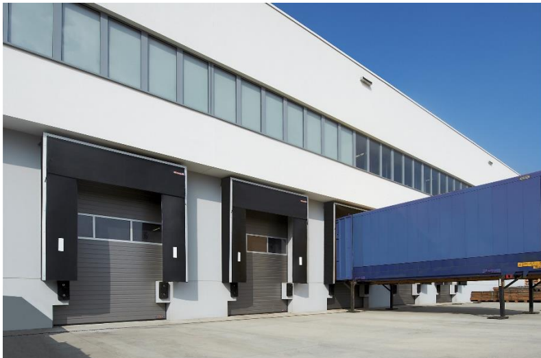
Bild 4: Mit energieeffizienten Tor- und Verladetechniklösun- gen können Wärmeverluste reduziert und Energiekosten gesenkt werden. Wie z. B. mit den Industrie-Sektionaltoren der Baureihe 60 von Hörmann, die sich durch eine hohe Tor- laufgeschwindigkeit von bis zu 1 m/s und gute Wärmedäm- mung auszeichnen. Die hohe Torlaufgeschwindigkeit der schnellsten Sektionaltore am Markt zeigt dieses Video im Geschwindigkeitsvergleich.

Bild 3: Vor allem im gewerblichen Bereich tragen wärmege- dämmte Tore entscheidend zur Reduzierung von Energie- verlusten bei. Hier im Bild: Hörmann Industrie-Sektionaltor SPU F42 mit 42 mm Bautiefe und guter Wärmedämmung (rechts) und Hörmann Industrie-Sektionaltore SPU 67 Ther- mo mit 67 mm Bautiefe und besonders guter Wärmedäm- mung (links).