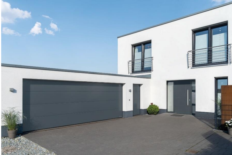
Bild 2: Vor allem wenn Garagen direkt ans Haus anschließen, kommt es auf eine besonders hohe Wärmedämmung des Garagentores an. Hörmann bietet verschiedenste Tor- und Türlösungen für den Wohnungsbau an, deren Wärmedämmwerte sogar weit unterhalb der gesetzlichen Vorgaben liegen.