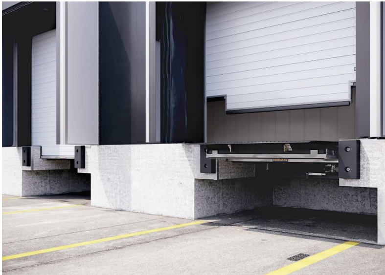
Bild 6: Neben gedämmten und schnell laufenden Toren sind auch energieeffiziente Verladekonzepte wichtig, wie z. B. die hydraulische Vorschubladebrücke HTL2 ISO von Hörmann, die mit 50 mm starken Isolationspaneelen für eine bis zu ca. 55 % bessere Wärmedämmung im Vergleich zu herkömmlichen Ladebrücken sorgt.

Bild 5: Das Hörmann Schnellauftor HS 5040 TurboLux gilt als das schnellste Spiraltor der Welt. Mit einer maximalen Öffnungs- und Schließgeschwindigkeit von 4 bzw. 3,5 m/s minimiert das Tor längere Aufstehzeiten und reduziert damit die Lüftungswärmeverluste.