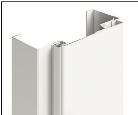
Bild 3: Bei der Montage der Stahlfutterzarge VarioFix von Hörmann entfällt die Arbeit mit Mörtel. So ist ein einfacher Einbau wie bei Holzzargen möglich. Zusätzlich deckt sie Toleranzen in der Wandstärke bis zu 20 mm ab.