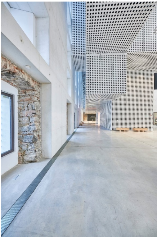
Bild 3: Innen ist der bestehenden Fassade eine Stahlbetonwand vorgesetzt. An einigen Stellen sind die Schichten des Wandaufbaus gut ablesbar.

Bild 2: Klar gerastert: Die Fassadenansicht der Rückseite der alten Zuckerfabrik Cukrarna ist geprägt von vielen kleinen Fensteröffnungen. Im Norden begrenzt der Fluss Ljubljanica das Grundstück.