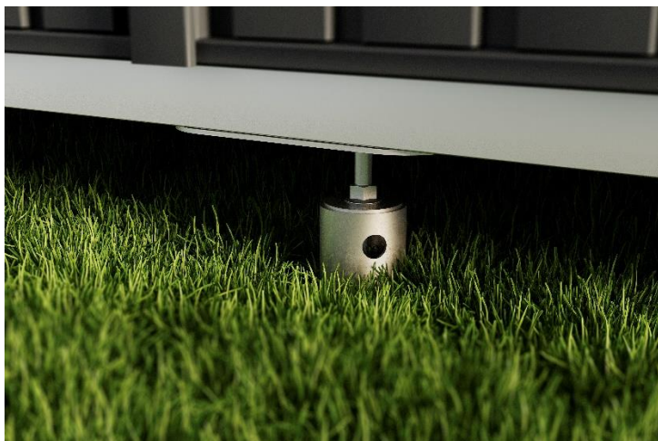
Bild 3: Für die Montage des Gerätehauses auf unebenen Böden bietet sich das Schraubfundament von Hörmann an.

Bild 2: Das Gründach von Hörmann dient neben der optischen Aufwertung auch als Witterungsschutz.