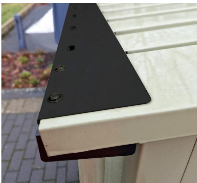
Bild 4: Die optionale Laubabdeckung verhindert das Eindringen von Laub in die Dachrinne vom Gerätehaus.

Bild 3: Für die Montage des Gerätehauses auf unebenen Böden bietet sich das Schraubfundament von Hörmann an.