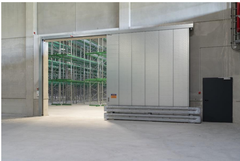
Bild 7: Die 20 im Mach 2 verbauten Hörmann Feuerschutz-Schiebetore vom Typ FST 90-1 befinden sich an den Durchgängen zwischen den einzelnen Hallenbereichen und verhindern im Brandfall ein Ausbreiten des Feuers. Sie schließen bei Brandgefahr automatisch und halten Feuer mindestens 90 Minuten stand.

Bild 6: Bei den im Mach 2 verbauten Industrie-Sektionaltoren von Hörmann wurde im Interesse einer möglichst einfachen und wartungsarmen Bauweise auf einen elektrischen Antrieb verzichtet.