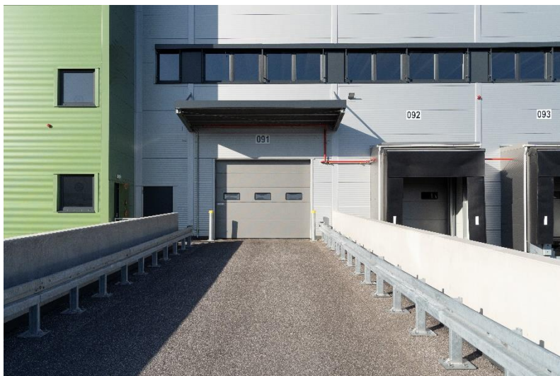
Bild 3: 14 ebenerdige Hörmann Industrie-Sektionaltore vom Typ SPU F42 können dank ihrer Höhe von vier Metern nicht nur von Transportern, sondern auch von Sattelschleppern genutzt werden.

Bild 2: Hörmann lieferte für das Leuchtturmprojekt 100 Sektionaltore vom Typ SPU F42, die im 1. Stock mit Vorsatzschleusen vom Typ LHP 2 kombiniert wurden.