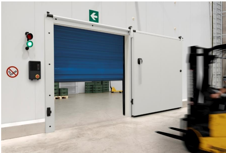
Bild 5: Zwei Lösungen aus einer Hand für die Tiefkühllogistik: Hörmann Faltschnellauftor F 4010 Cold und Isolierschiebetüren lassen sich für optimale und effiziente Betriebsabläufe kombinieren.

Bild 4: Die Schiebetüren können mit PE-Pendeltüren von Hörmann kombiniert werden. Während die Schiebetür für die Entnahme oder Einlagerung von Waren geöffnet ist, bleibt durch die geschlossene Pendeltür die kalte Luft im Kühl- oder Gefrierraum, was den Energieverbrauch senkt.